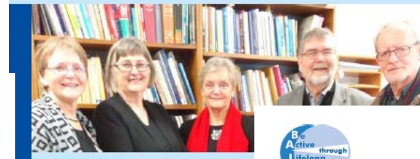
The Mapping team of U3A Reykjavik